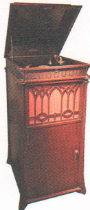
Edison ダイヤモンドディスク蓄音機 1919年

機械式蓄音器の最高峰、米ビクター社製。 音響理論に基づく初めての再生装置で、内蔵 されたホーンの全長は1.8m、再生帯域は 100Hzから4kHzまで殆どフラット。 キャビネット・デザインは、Credenzaの名が 示すように、イタリアン・ルネッサンス・スタイル を手本とした美しい仕上がりとなっています。