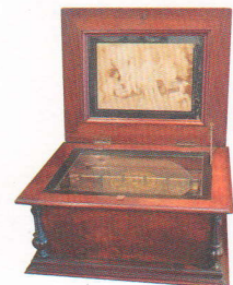
独Symphonion社製 ディスクオルゴール 1910年頃

ビクター蓄音機で最初のモデルであるタイプ Eで、オリジナル22インチの真鍮色と黒色の ホーンが付属しています。 モナークジュニアとして公式に知られており、 コレクターの間で広く愛されています。