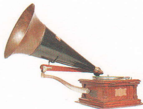
米Victor社製 蓄音器 1902年

イギリスの著名な宮廷家具師 Thomas Chippendale(1718~1779年)のデザインと 名を冠したこのモデルは、デザイン・サイズ・ 再生音と、どれを取っても他を寄せ付けぬ性 能を有しています。 同タイプ機種種のC-250型には、本物の歌手が歌 う途中で蓄音機とすり替えても殆どの観客が 気付かなかったという有名な逸話があります。