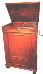
米Victor社製 機械式蓄音器 1926年