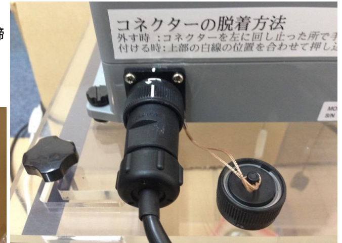
③比重センサーに専用ケーブルを接続