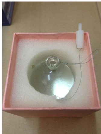
⑤ガラス玉に釣り糸を通す