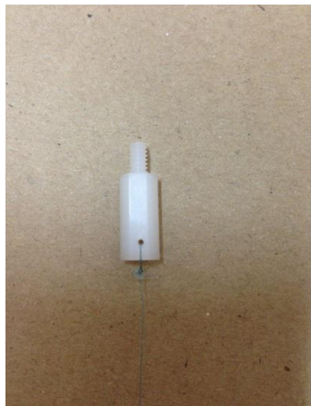
④釣り糸連結部の取外し