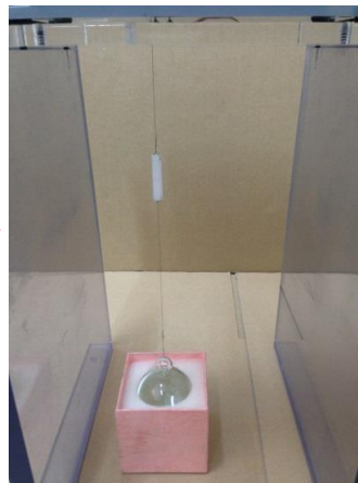
⑥釣り糸連結部の取付