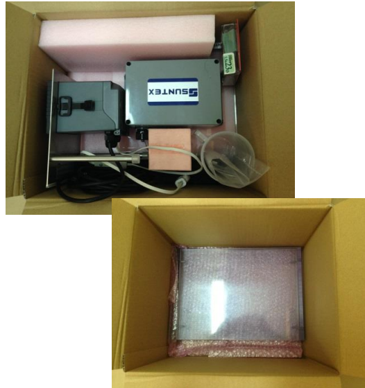
①梱包箱から比重計一式を取り出す